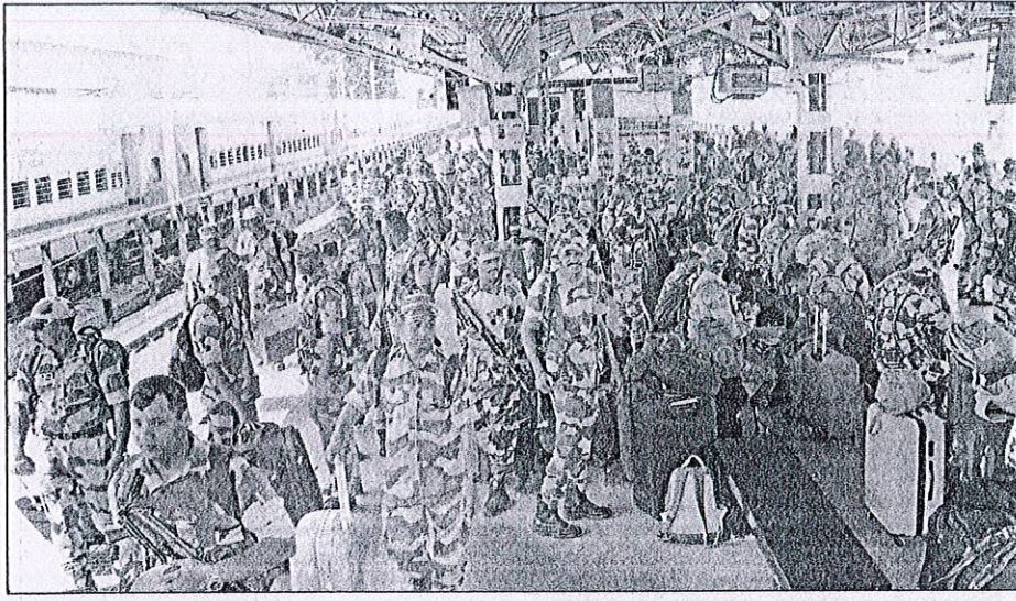
நாடாளுமன்ற தேர்தல் பணிக்காக கேரள மாநிலம் கொச்சியில் இருந்து நேற்று கோவைக்கு ரெயில் மூலம் வந்த துணை ராணுவத்தினரை படத்தில் காணலாம்.