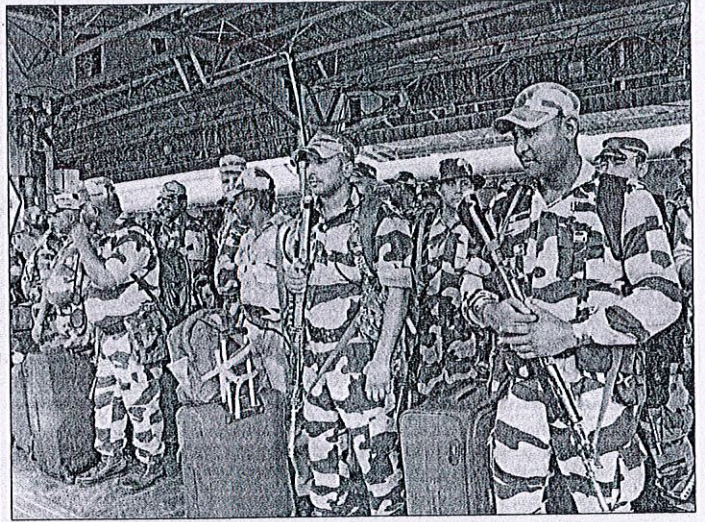
↑ மக்களவை தேர்தல் பாதுகாப்பு பணிக்காக கொச்சியில் இருந்து ரயில் மூலமாக கோவை வந்த துணை ராணுவப் படை வீரர்கள்.