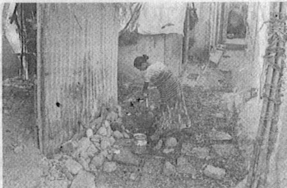
For over three decades, the residents of Puliyanalalai have lived in makeshift shelters on land belonging to the Pudukcherry Housing Board