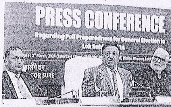
Strict vigil: Chief Election Commissioner Rajiv Kumar and others addressing a press conference on Saturday.

Chief Election Commissioner Rajiv Kumar said that directions have been issued to all the District Magistrates and SPs to ensure level playing field for all the political parties, and to take strong action