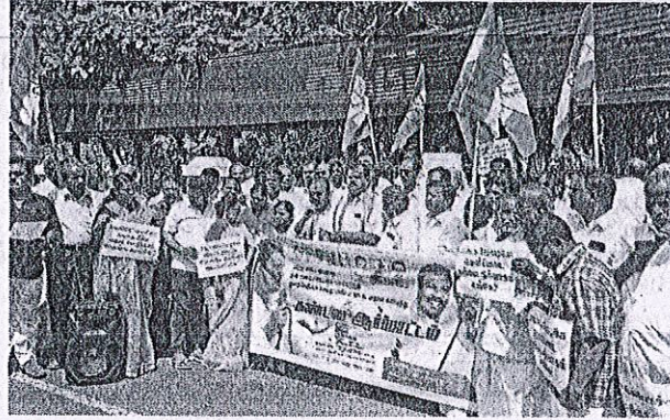
Congress members stage protest against State Bank of India in Tiruchy on Thursday

They charged that the Union government has been misusing the bank for its gain and asked why the bank was not