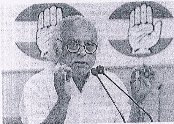
Hitting hard: Former Union Minister Jairam Ramesh says the SBI's request for time until June 30 was 'conveniently timed'. FILE PHOTO

The former Union Minister said the SBI's request for extension was "conveniently timed for after the upcoming Lok Sab-