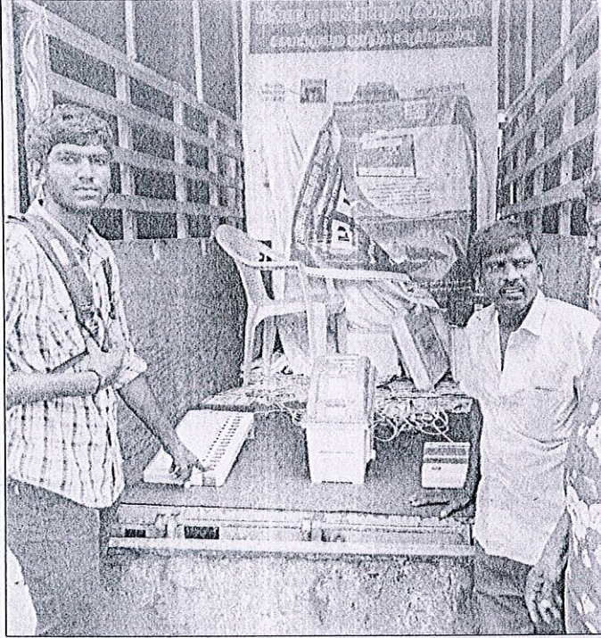
↑ சென்னை மாநகராட்சி சார்பில், கீழ்ப்பாக்கம் டெய்லர்ஸ் சாலையில் விவிபேட் இயந்திரம் குறித்து மக்களுக்கு விழிப்புணர்வு ஏற்படுத்தப்பட்டது.