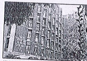
'FATE OF DEMOCRACY'