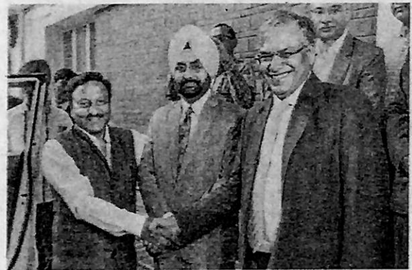
Warm exchange: Outgoing Chief Election Commissioner Rajiv Kumar (left) with new appointee Gyanesh Kumar on Tuesday.

Election Commissioner Gyanesh Kumar was appointed CEC on Monday. He is the first CEC to be appointed under the 2023