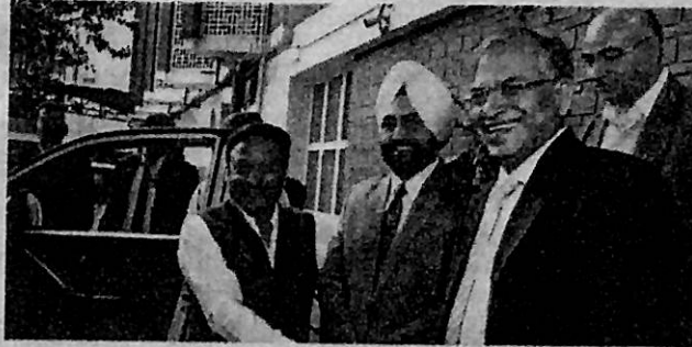
Outgoing CEC Rajiv Kumar greeting new commissioner Gyanesh Kumar in New Delhi on Tuesday

The Supreme Court on Tuesday said it would on February 19 take up on "priority basis" the pleas against the appointments of the chief election commissioner (CEC) and election commissioners (EC) under the 2023 law.