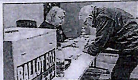
Critics call move Trump bid at disenfranchising legitimate immigrant and minority voters to ensure Republican primacy

Although only citizens can vote in federal elections, some states require voters to provide proof of citizenship to vote, while others require voters to only sign statements swearing they are citizens. Non-citizens who sign such statements can be charged with crimes and de-