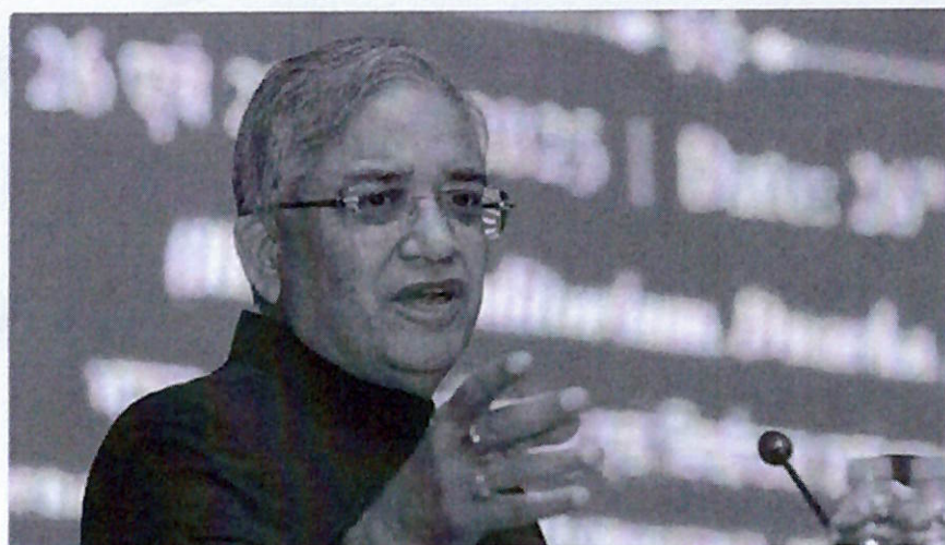
Chief Election Commissioner (CEC) Gyanesh Kumar on Wednesday revealed it takes 10,50,000 booths, 1,00,000 booth level officers to conduct an election in India.

Chief Election Commissioner (CEC) Gyanesh Kumar on Wednesday revealed that conducting an election in India requires 10,50,000 booths and 1,00,000 booth-level officers.