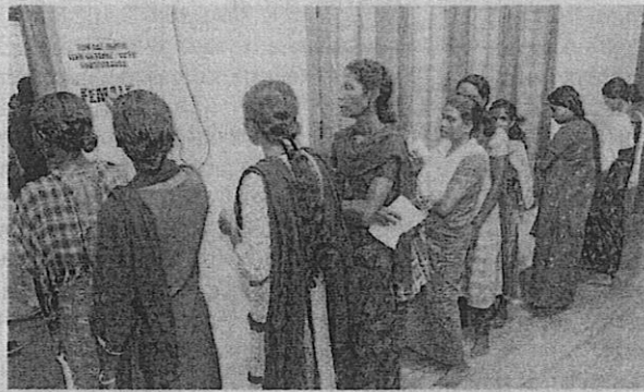
Right to franchise: Voters wait to cast their votes for the Wayanad Lok Sabha byelection on Wednesday.

Good polling was reported in the landslides-af-