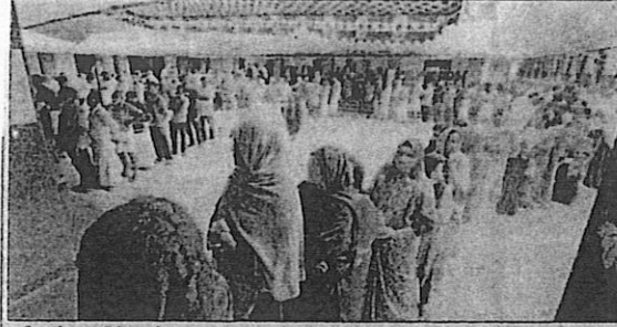
சேலக்கரையில் உள்ள ஒரு வாக்குச்சாவடியில் வாக்காளர்கள் நீண்ட வரிசையில் காத்திருந்ததை படத்தில் காணலாம்.