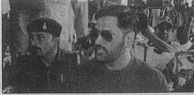
↑ ஜார்க்கண்ட் தலைநகர் ராஞ்சியிலுள்ள ஒரு வாக்குச்சாவடிக்கு வாக்களிக்க வந்த எம்.எஸ்.தோனி.

ஜார்க்கண்ட் மாநில ஆளுநர் சந்தோஷ் குமார் கங்வார், ராஞ்சியில் உள்ள ஏடிஐ வாக்கு மையத்தில் வாக்களித்தார்.