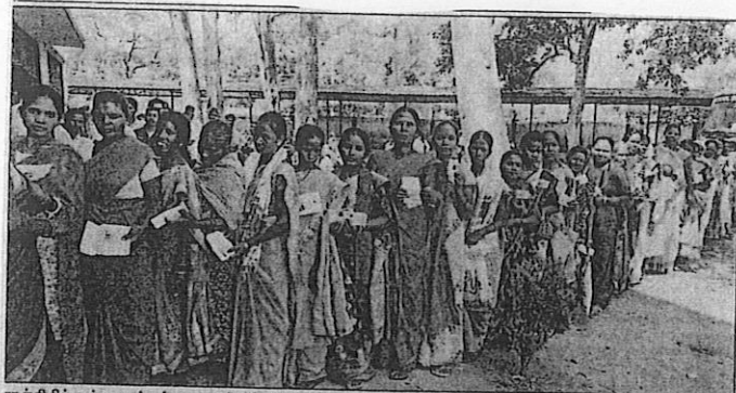
ராஞ்சியில் உள்ள வாக்குச்சாவடி ஒன்றில் ஒட்டுப்போடுவதற்காக வாக்காளர்கள் நீண்ட வரிசையில் காத்திருந்த காலம்.

ராஞ்சி, நவ.14 ஜார்கண்டில் நடந்த முதல்கட்ட சட்டசபை தேர்தலில் 66 சதவீத வாக்குகள் பதிவானது.