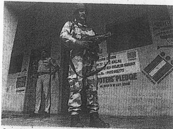
Security personnel stand guard outside a polling booth near the Line of Control ahead of the Phase-2 of the Jammu and Kashmir Assembly polls in Nowshera of Rajouri district on Tuesday.