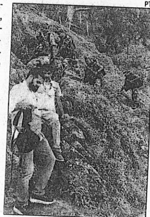
TERRAIN NO BAR: Officials trek to a remote spot in Reasi district

Omar is contesting from Budgam and Ganderbal — a traditional NC stronghold. The Abdullah family has represented Ganderbal since 1977, beginning with party founder Sheikh Abdullah, followed by his son Farooq Abdullah and later Omar, who won the seat in 2008 after losing in 2002.